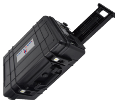
3600 キャリーバック式