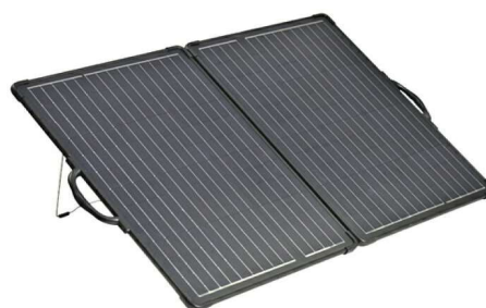
BA-3000用ソーラーパネル