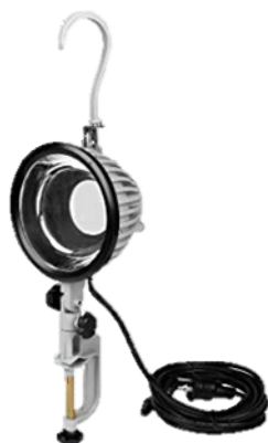
フック・クランプ式