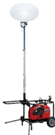
キャスター式 ※発電機別